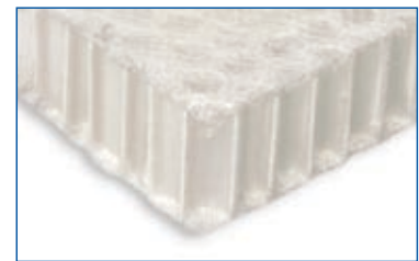
Nid d'abeille en polypropylène