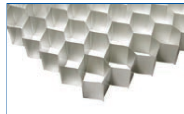
Alveolare in alluminio